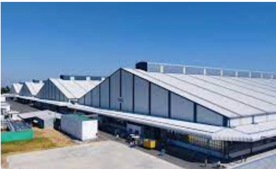
Công ty TNHH Sản Xuất Bao Bì Dương Vinh Hoa – Tỉnh Long An