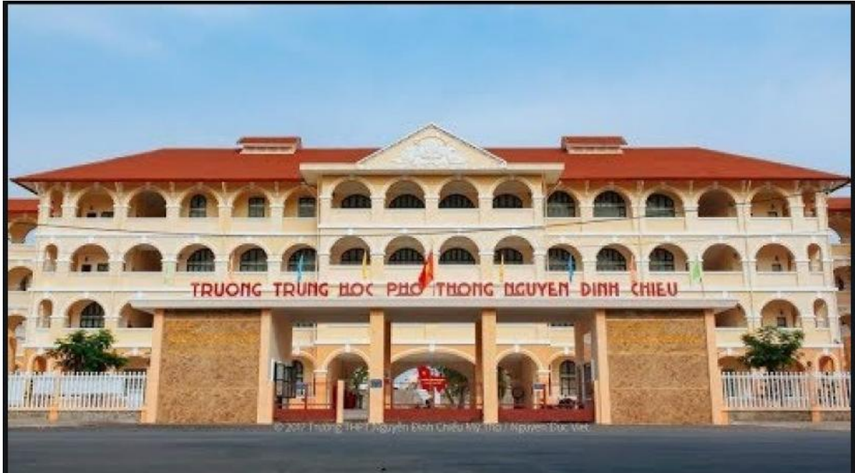
Công trình nhà dân dụng